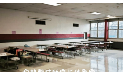
安静整洁的家长休息室