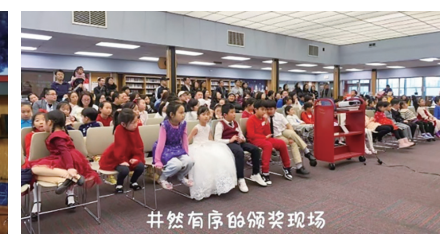
井然有序的颁奖现场