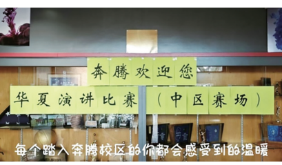
每个踏入奔腾校区的小伙伴都会感受到的温暖