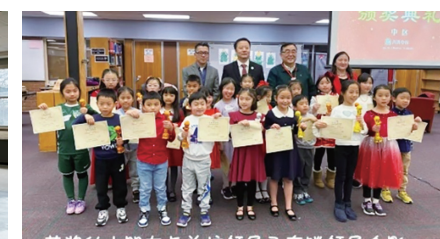
获奖的小朋友与总校领导在奔腾领导合影