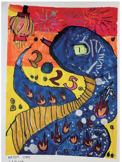
陈于淞 Killian Chen 5岁 蛇年画