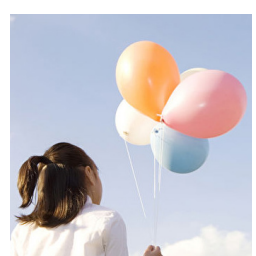
2021年六月的时候，我的学校举办了一场八年级的毕业舞会。我参加了这个舞会，那天很好玩！

我们平常最常做的是联想式教学，比如学到 m，就联想到妈妈，然后让小朋友讲讲自己的妈妈，有的小朋友讲妈妈