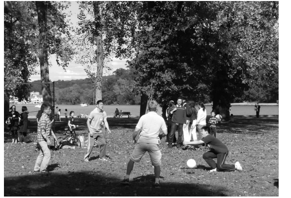
(附图:HXNY-Photo3.jpg, 纽约分校迎新烧烤会-Hudson河畔排球赛)

再有,喜欢画画的孩子可以把自己的画挂在外面,让每个人都可以看到,让我们觉得,这是我们自己的学校。 最后,我在管理中文学校的时候,会让课堂里玩更多的游戏。这样,孩子们会学得更好,会更聪明,所以会喜欢学习中文。在每个星期六,学生会想:“明天是中文学校了!”因此变得很开心。 这样的中文学校,学生喜欢,大人也会。我觉得中文学校,应该大人和孩子都喜欢才好。