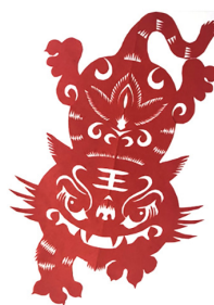
祝大家虎年健康吉祥!

同一天的晚上，中部分校的春晚也在线上隆重举行。全校师生以班级为单位进行拜年、表演节目，最热闹的谜语竞猜，看图填诗、诗句接龙。题目刚刚放上屏幕，孩子们就先恐后地大声报出答案，充分展现了学生们中文学习的成果和进步。近三个小时的30个节目和抽奖结束时，人们意犹未尽，恋恋不舍。