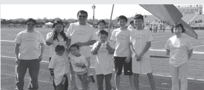
华夏中部分校参加“2015华夏田径运动会”