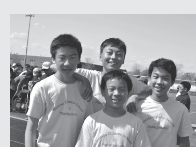
儿童组4x100米接力中取得了第一名优异成绩的四位孩子。看着他们的笑容,我们为这些在美国长大的他们而感到骄傲。

直接注册系统,这一新措施将为家长和老师们带来更多便利。凡有网上注册问题,请登录 www.hxcsmg.org ,或通过e-mail与本校联系( hxcsmg.reg@gmail.com )。在本学期结束前,也可到校办公室咨询。