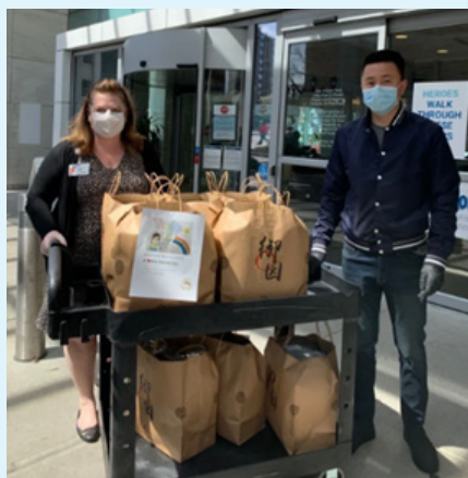
送餐至 White Plains Hospital ER. 学生设计的问候语随餐送到