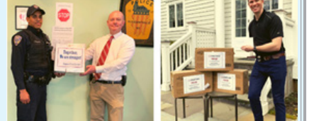
守护家园 共同抗疫 回报社区,华人掀起捐赠PPE活动