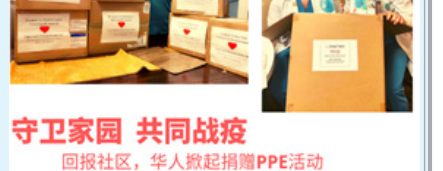
守护家园 共同抗疫 回报社区,华人掀起捐赠PPE活动