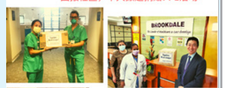
守护家园 共同抗疫 回报社区,华人掀起捐赠PPE活动