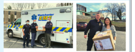
守护家园 共同抗疫 回报社区,华人掀起捐赠PPE活动